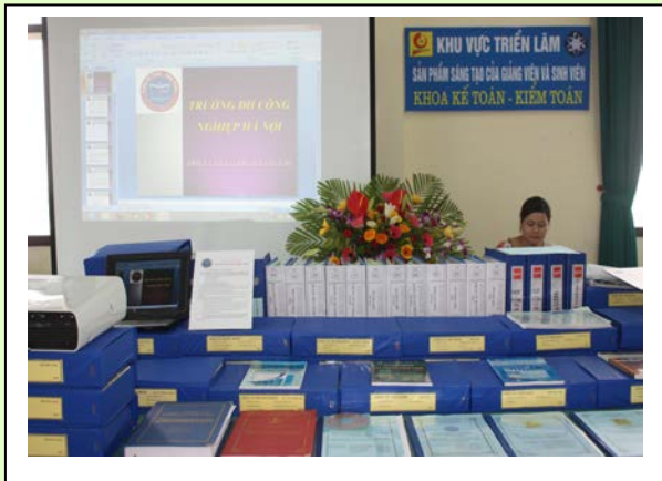
Tài liệu học tập