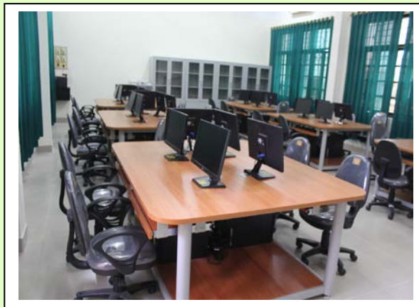
Phòng thực hành

Giảng viên là ai? Các giảng viên giàu kinh nghiệm của Khoa kế toán - Kiểm toán trường ĐHCNHN sẽ tham gia giảng dạy khóa học này. Họ đã có 15 năm kinh nghiệm thực tế tại các doanh nghiệp, là chuyên gia tư vấn về kế toán và thuế