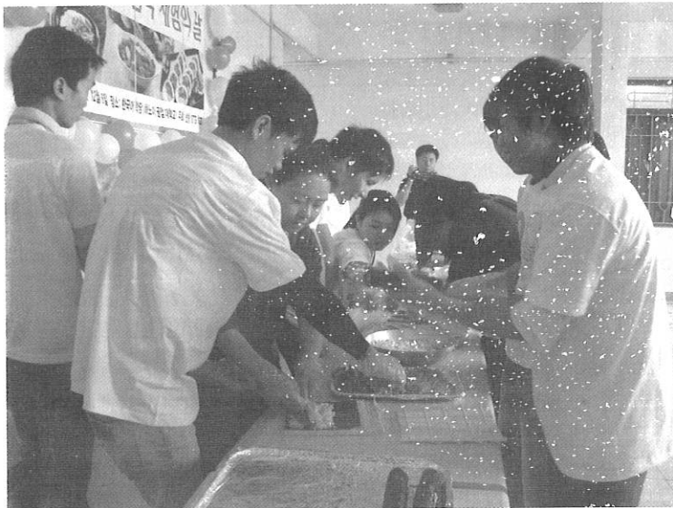
Học viên của Trung tâm học làm các món ăn truyền thống của người Hàn Quốc tại buổi sinh hoạt ngoại khóa do Trung tâm tổ chức ngày 6/12/2011.

nội dung của chương trình hợp tác trao đổi HSSV nhằm tạo điều kiện cho HSSV có đủ năng lực tiếng Hàn Quốc phục vụ việc học tập và sinh hoạt hàng ngày khi sang học tập, nghiên cứu tại Trường Đại học Jeonju Kijeon.